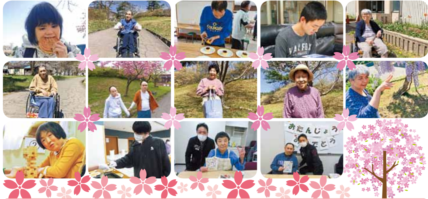
春の訪れとともに屋外散歩やドライブ外出を再開しました。皆様は、季節の花や空気に触れ穏やかに過ごされています。 広報委員 櫻庭

社会福祉法人 青森県すこやか福祉事業団 障害者総合福祉センター 「なつどまり」 青森県東津軽郡平内町 大字小豆沢字茂浦沢38番地 TEL 017-755-4001 FAX 017-755-4919 http://www.natodomari.jp/